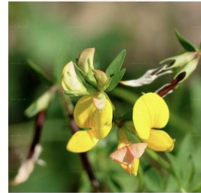
Grösse: 5 bis 30 cm Blütezeit: 5 - 7 Standort: so, ma, trocken

Jeder Quadratmeter zählt, sogar die Bluemechschtlis bieten Raum für die Blütenpracht von Wildstauden und Nahrung für Bienen und Schmetterlinge. Biodiversität als Grundlage für unsere eigene Gesundheit ist vermehrt im Focus: Sauberes Wasser, gesunde Ernährung, medizinische Wirkstoffe in Heilkräutern bewirken viel Gutes.